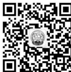
法律人微信平台 (学生风采与学生事务)