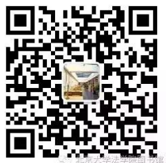
法学院法律图书馆