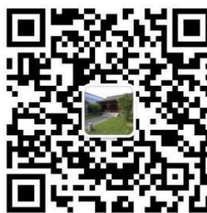
PKU Law Global Program (国际交流)