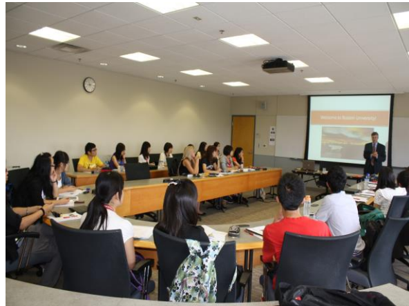
波士顿大学 法学院课堂