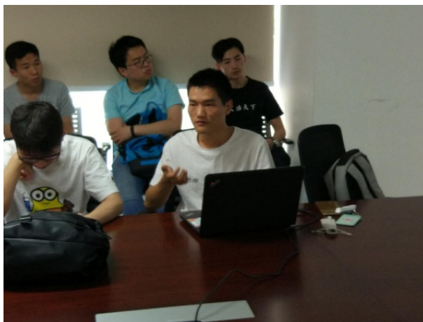
图 2 同学们就会议内容分享交流

重要讲话的内容和精神有了更为深入的理解和认识，对同学们今后的学习科研以及社会服务都起到了十分重要的促进作用，青年强则中国强，同学们纷纷表示会牢记习总书记的嘱托，牢记北大学子的使命，为国家和民族的发展与腾飞砥砺前行，努力奋斗！