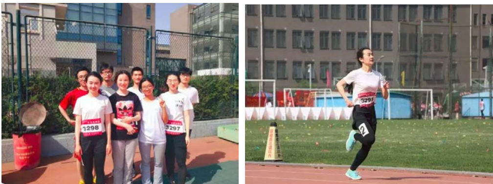
图 18 我支部成员积极参加春季运动会并取得优异成绩

经过一天的努力，我支部取得了环境学院近几年来突破性的成绩，最终环境学院也取得全校乙组团体总分第二名的耀眼成绩。在参加比赛的过程中，支部成员们增强了体魄，锤炼了意志，收获了友谊。