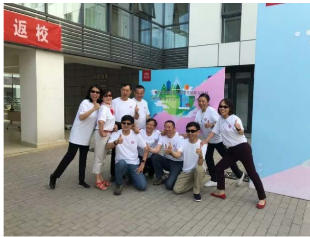
图 21 校友参与闯关竞赛活动

关竞赛活动的序幕，该活动依照环境学院发展历程中的重要时间节点设置关卡，参与者根据游戏背景回到了过去，成为在北京大学环境科学与工程学院不同时期就读的学生，依据信函的提示在指定地点完成当时时期的环境问题或北大校史相关的游戏或问答，解锁通往下一个时空的通道。广大师生和返校校友热情参与，在环境大楼及周边挥洒着智力和汗水，感受着学校和学院历年来的风雨变迁，最后来到北京大学 120 周年校庆纪念展板前合影留念，校友们用点滴细节回忆燕园青春、珍藏环院时光！