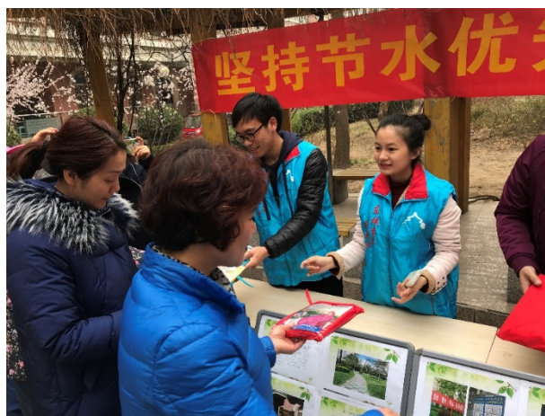
图8 党员同志们开展节水宣传活动

知识进行讲解。社区居民以老年人居多，对很多知识和做法理解起来存在一定的困难，党员同志们利用自己的专业知识，用通俗易懂的方式耐心为社区居民一一解答，会场中不时传来阵阵掌声和欢笑声。