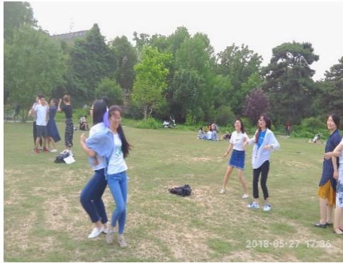
图 4 同学们进行破冰活动