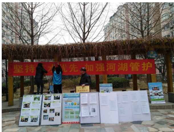
图 7 党员同志布置会场

3 月 28 日上午，环境科学与工程学院 2017 级硕士支部一行 8 人来到东城区西花市南里西区开展“水之魂·节水宣传进社区”活动。活动开始前，同学们早早的来到活动场地，在社区工作人员的协助下进行会场布置。为了便于社区居民更好的理解节约用水的相关知识，党员同志们结合社区居民的特点制作了形象生动的横幅、海报和宣传页，社区的小广场在党员同志们的精心准备下俨然成为了一个节水知识大讲堂。