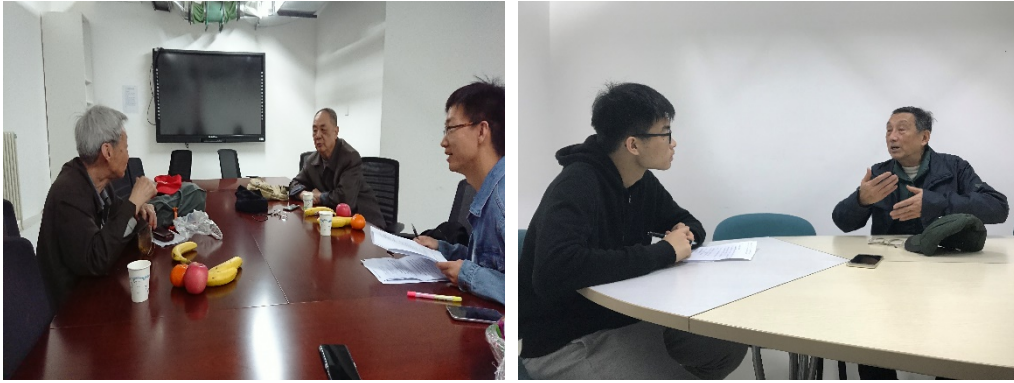
图 1 同学们采访退休老党员