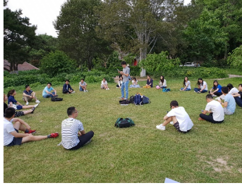
图 5 同学们进行知识竞赛活动

在本次“青年双手、绿色希望”——全国生态环境保护大会会议精神学习系列活动中，环境科学与工程学院 2017 级硕士班党支部将理论学习与实地素拓相结合，形式活泼，寓教于乐，让同学们对生态环境保护大会的相关内容有了深刻的了解，提升了同学们的环保责任感和使命感。作为一流高校学府的环境学子，此次活动将极大地激励两校环境学院学子不忘初心、牢记使命，做好科学研究工作，为美丽中国的建设而不断努力！