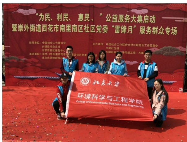
图 11 志愿服务同学合影