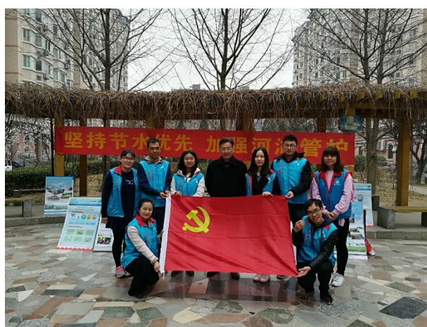
图9 党员同志与社区负责人合影

活动结束后，同学们对一些社区居民进行了访谈，居民们纷纷对同学们的志愿活动表示感谢。一些居民表示：从党员同志们的各种表现中，他们看到了年轻一代的热情与活力，也感受到了北大环境学子的理想抱负与精神风貌，希望同学们能够利用自己所学更多的服务于基层，开展有益的志愿活动。