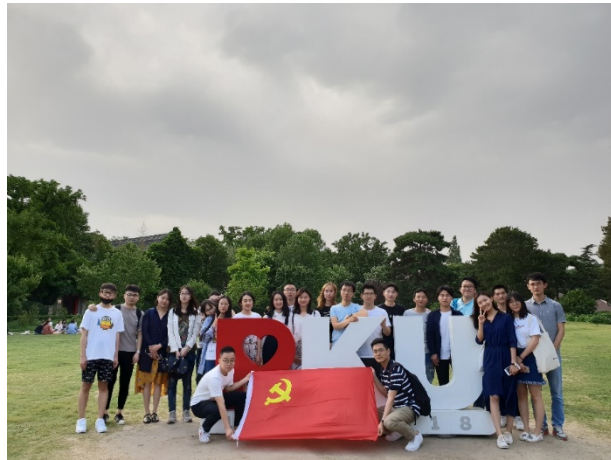
图 6 活动现场合影

在本次“青年双手、绿色希望”——全国生态环境保护大会会议精神学习系列活动中，环境科学与工程学院 2017 级硕士班党支部将理论学习与实地素拓相结合，形式活泼，寓教于乐，让同学们对生态环境保护大会的相关内容有了深刻的了解，提升了同学们的环保责任感和使命感。作为一流高校学府的环境学子，此次活动将极大地激励两校环境学院学子不忘初心、牢记使命，做好科学研究工作，为美丽中国的建设而不断努力！