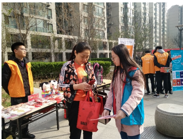
图 10 同学们在社区开展活动

在此次活动中，我支部同学对五大青年行动的相关活动进行了宣传和普及，在大气环境保护、节水护水宣传、固废清理等方面进行科教宣讲，使更多的社区群众增强环保意识，并懂得该如何在生活中践行环保，同时保护自己的身体健康。在同学们的共同努力下，越来越多的群众参与到了我们的活动当中，与各位同学交流日常生活中的环保困惑，同时也为我们活动的进一步开展提出了宝贵的意见和建议。