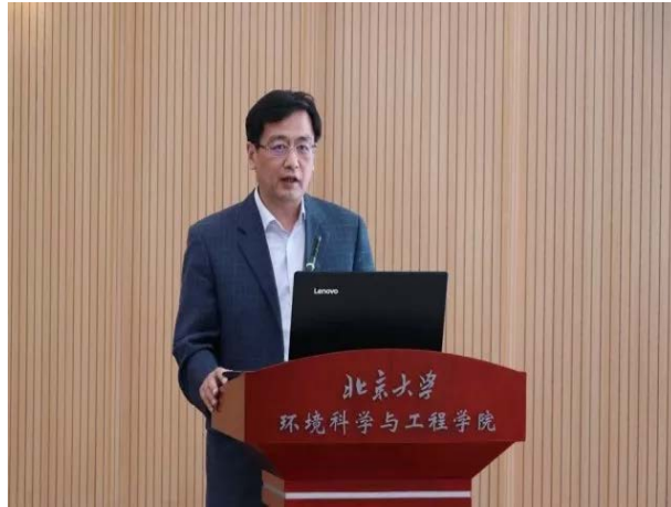
图 22 参会代表主题发言

2018年5月4日，值此北京大学建校120周年、环境科学与工程学院成立11周年与环境学科建立46周年之际，“百廿北大、环聚未名”——喜迎北京大学建校120周年系列活动成功举办，学院师生与众多校友共同见证学校和学院的开拓与建设，百廿回首、筑梦未来，环境科学与工程学院全体师生、校友将继承“爱国、进步、民主、科学”的光荣传统和“思想自由，兼容并包”的学术精神，以更加坚定的信心、更加饱满的热情、更加执着的努力，实现碧水蓝天的宏伟梦想，向用心血铸就今日之北大的先贤们致以最崇高的敬意！