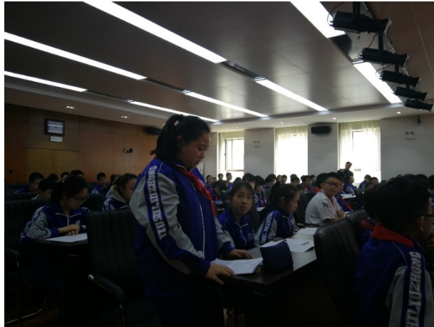
图 14 同学提问环节

通过此次活动，环境学院同学在实践专业知识的同时也实现了和学校青少年的接触，此次活动实现了让志愿服务“走进群众，走进生活”的目标，同时在志愿活动的组织度、活跃度和显示度上都有所提升。在此次活动中，北大学子充分展现了服务社会、服务人民的社会责任感和使命感。