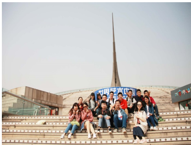
图 16 我支部成员开展户外素拓活动

在党团支委的精心策划下，支部成员彼此深入了解，互相帮助，以这次活动为起点，2017级硕士班又开始了新学期真正凝聚为一个整体。