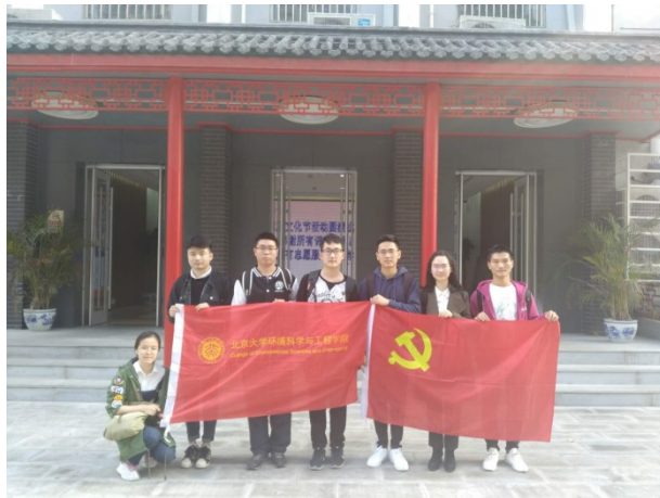
图 15 参加活动志愿者合影

通过此次活动，环境学院同学在实践专业知识的同时也实现了和学校青少年的接触，此次活动实现了让志愿服务“走进群众，走进生活”的目标，同时在志愿活动的组织度、活跃度和显示度上都有所提升。在此次活动中，北大学子充分展现了服务社会、服务人民的社会责任感和使命感。